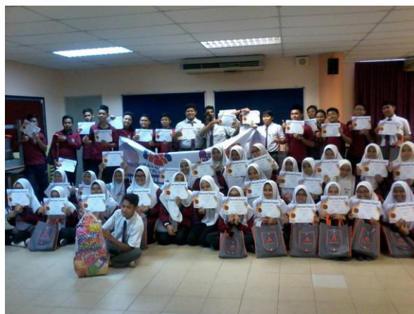
Sesi bergambar (setiap pelajar mendapat sijil penyertaan dari P11M)