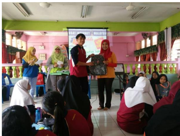
Sesi penyampaian hadiah dan cabutan bertuah