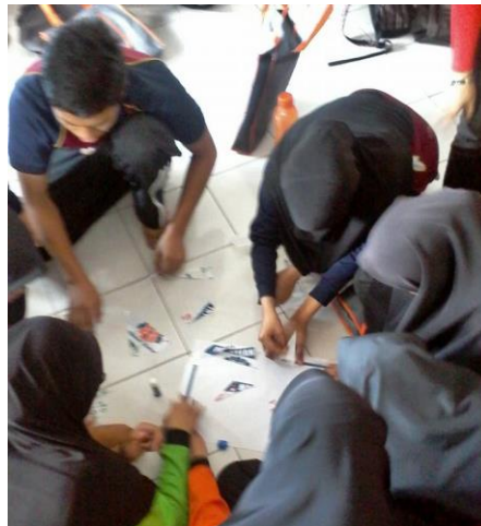
Di antara aktiviti berkumpul iaitu menyusun puzzle dashboard komuniti pi1m