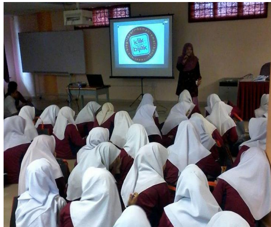
Sesi Taklimat KDB & My Skool