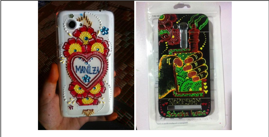
Antara tempahan ukiran pada casing cover handphone