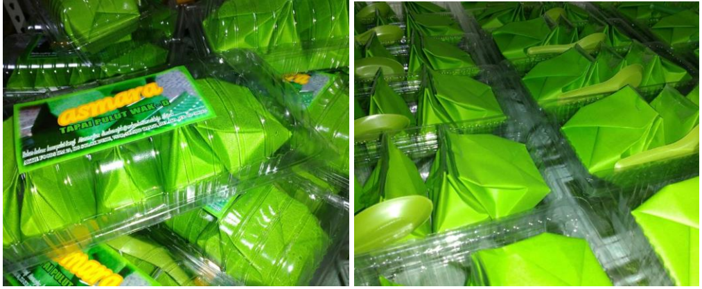
Tapai pulut yang telah dipaketkan untuk dihantar ke kedai-kedai