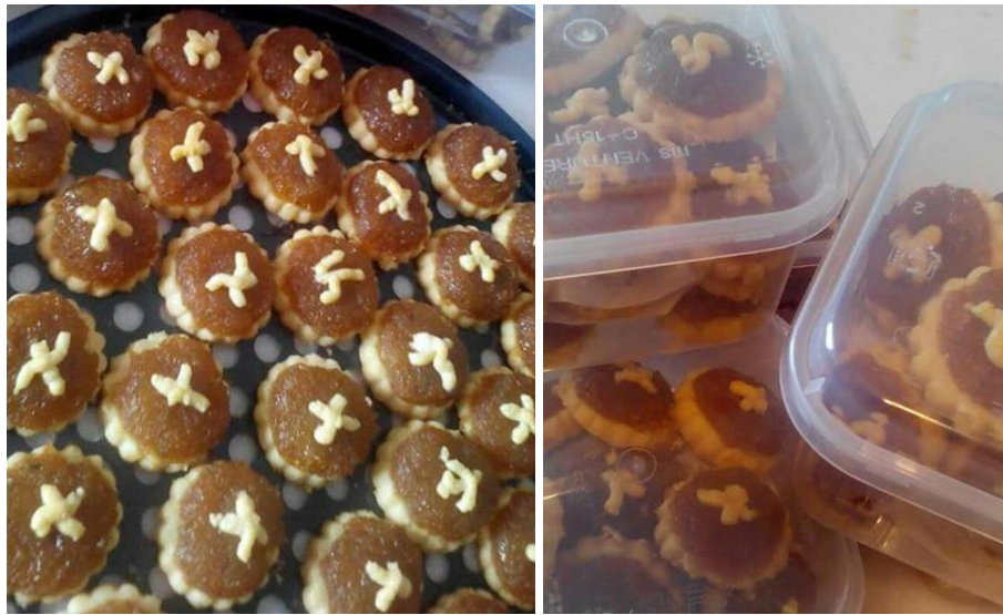
Tempahan Tart Nyonya